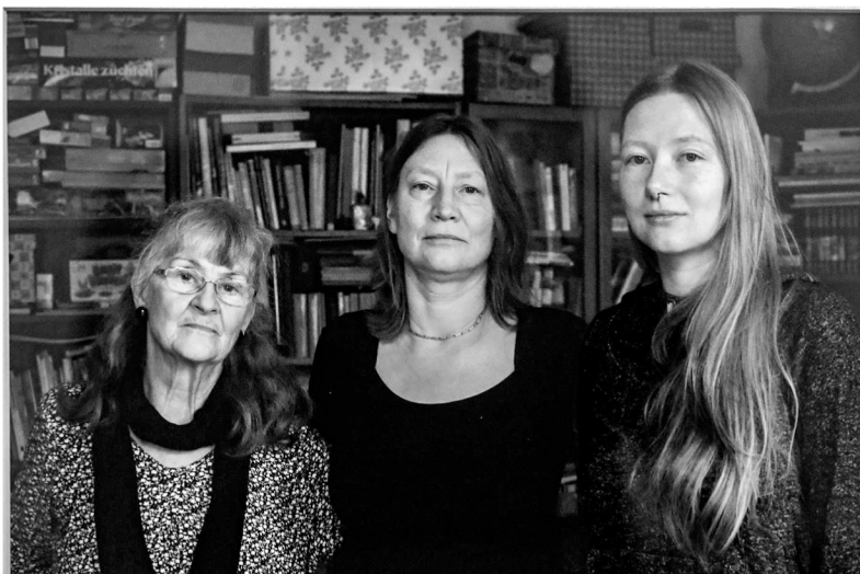
Eine Serie im Foto-Langzeitprojekt widmet sich dem Generationen-Thema.

➤ Vernissage am Freitag, 19 Uhr, Literaturhaus, Bernburger Straße