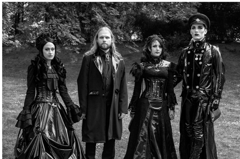
Diese Gothik-Fans hat Lipskoch für die Mappe „Hobby“ 2015 abgelichtet.