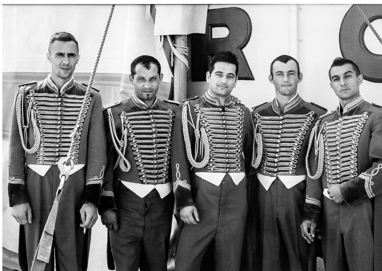
Imanegenhelfer im Zirkus, 2015

„Menschen des 21. Jahrhunderts“ hat der aus dem niedersächsischen Dissen stammende Foto-Künstler sein opulentes Werk übertitelt. Nun hat Lipskoch die erste Dekade des in mehreren thematischen Serien angelegten Projekts zum Anlass genommen, eine Auswahl dieser Bilder der Öffentlichkeit zu präsentieren. Nicht zum ersten Mal übrigens, denn vor Jahren gab es bereits eine zwar kleinere, aber dennoch vielbeachtete Exposition. Nun zeigt Lipskoch im Literaturhaus etwa 100 seiner insgesamt mehr als 350 Porträts in einer großen Ausstellung, die dem ambitionierten Langzeitprojekt mehr als gerecht wird. Kuratiert und organisiert wird die Präsentation im Literaturhaus vom in Halle neu gegründeten Verein „Helle Kammer“, der sich die Unterstützung und das Sichtbarmachen von Fotografen und deren Arbeiten zur Aufgabe gemacht hat.